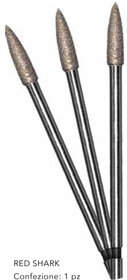
RED SHARK Confezione: 1 pz