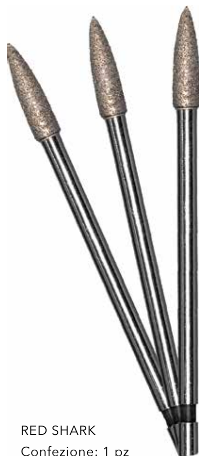
RED SHARK Confezione: 1 pz

Straordinariamente aggressive su qualsiasi materiale, anche i più duri